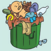
त्यागे हुए बच्चे