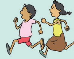
घर से भागे हुए बच्चे