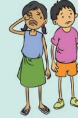
खोए हुए बच्चे