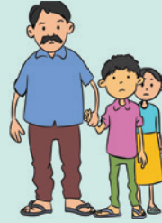
पाए गए बच्चे

जो बच्चे अपने परिवार/अभिभावक से अलग हो जाते हैं वे लापता कहलाते हैं, इनके साथ ही लापता की श्रेणी में नीचे दिए गए बच्चे भी शामिल होते हैं-