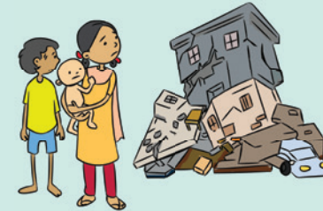
आपदा, दुर्घटना या अन्य किसी कारणों से खोए हुए, पाए गए या लापता बच्चे